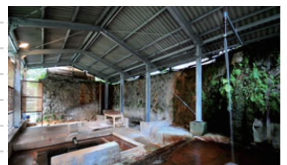
貸切風呂「うたせラムネ湯」