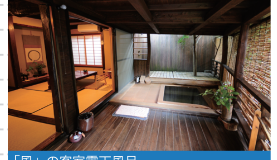
「風」の客室露天風呂