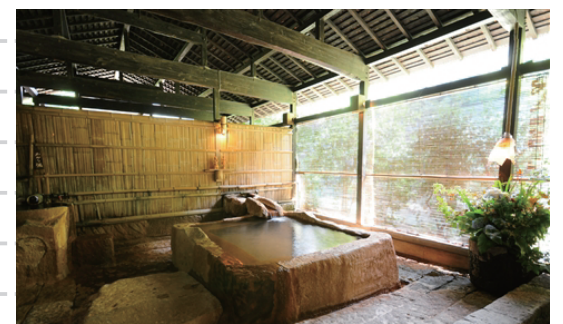
男女別浴場&貸切風呂「建湯（たけるゆ）」

炭酸ガスの無数の気泡が、肌に刺激を与え、毛細血管を拡張させる効果があるため、血液の循環を促進させ、血圧を下げる効果も期待できる。そのため「心臓の湯」とも呼ばれている。