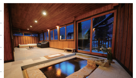
特別室離れ「椿」のお風呂リビング